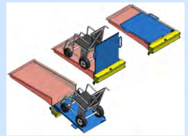
Rampe avec système FastFlex

Les informations et caractéristiques sur nos transformations correspondent à leurs définitions à la date de l'impression de ce document. Carrosserie DIJEAU Sarl se réserve le droit de modifier sans préavis les caractéristiques des transformations présentées, sans être tenu de mettre à jour ce document.