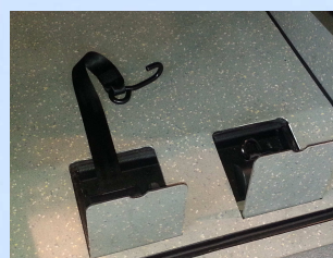
sangles AR escamotables

Les informations et caractéristiques sur nos transformations correspondent à leurs définitions à la date de l'impression de ce document. Carrosserie DIJEAU Sarl se réserve le droit de modifier sans préavis les caractéristiques des transformations présentées, sans être tenu de mettre à jour ce document.