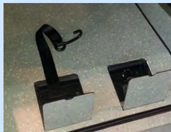
Option sangles AR escamotables

Notice d'utilisation, cde ouverture de secours AR et adhésif "Handicap" stylisé avec mention "stationnez à plus de 2 mètres".